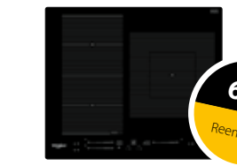
WF S9560 NE Inducción