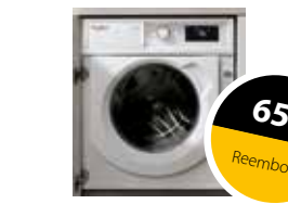
BI WMWG 81484E EU Lavadora