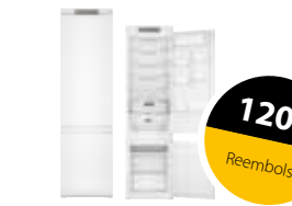
WHC20 T321 Frigorífico de integración