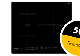
WB S5560 NE Inducción