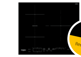
WB B3760 BF Inducción