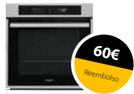
OAKZ9 7961 SP IX Horno Absolute