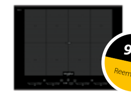
SMO 658C/BT/IXL Inducción SmartCook