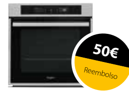
AKZ9 7891 IX Horno Absolute