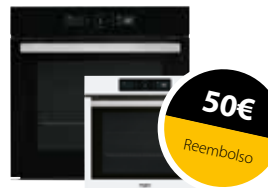
AKZ9 6290 WH / AKZ9 6290 NB Horno Absolute